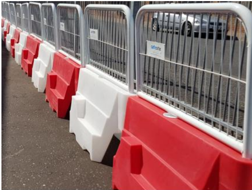
圖 3: 停機坪內圍欄樣式